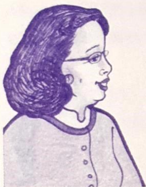
江 原 远大公司主管销售的 副总经理